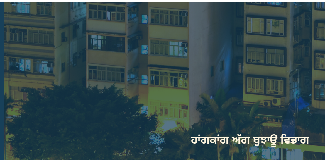
ਹਾਂਗਕਾਂਗ ਅੱਗ ਬੁਝਾਉ ਵਿਭਾਗ